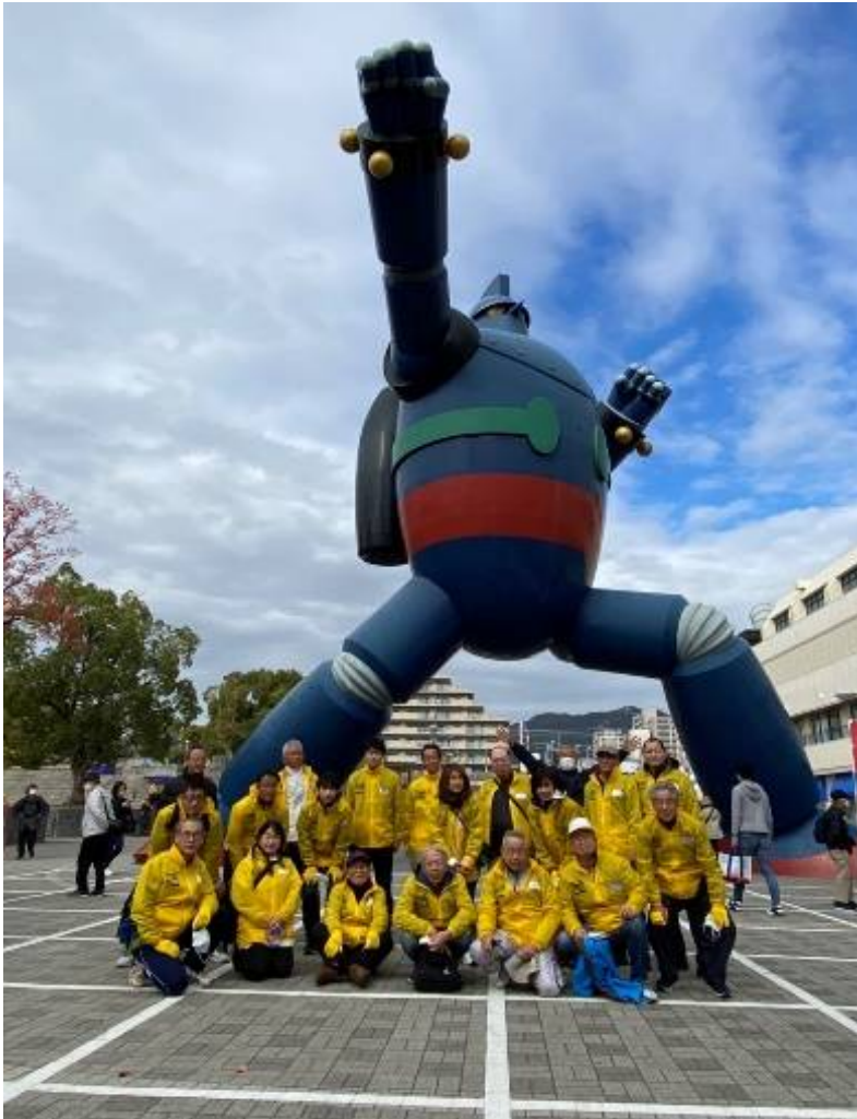
鉄人28号前での記念写真