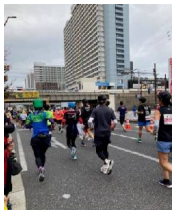
6.4km地点の9:30頃まだまばらです