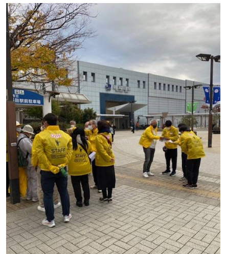
朝の打ち合わせ中